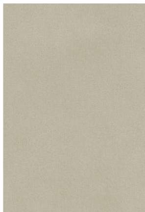
Slika cele ploče